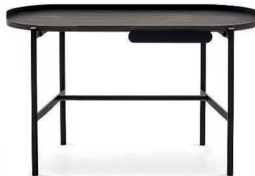
MADAME by Bernhardt & Vella per Calligaris. Versatile può essere accessorizzato anche con uno specchio. calligaris.com