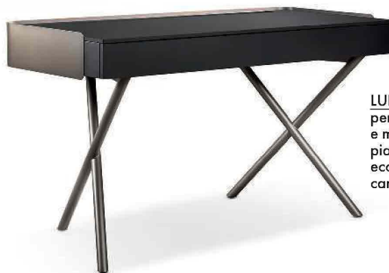
LUIS by Luca Roccadadria per Cantori. Legno e metallo, gambe a X, piano con tappetino in eco nabuk o pelle. cantori.it

Scrivoli per lavorare con stile, a casa o in ufficio. Da abbinare a sedie girevoli con gambe a razza o su stelo