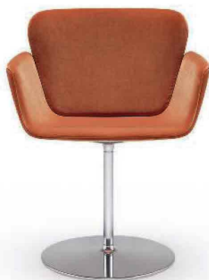
KN06 by Piero Lissoni per Knoll. Seduta a forma di guscio, girevole, con basamento iconico in metallo cromato. knoll-int.com