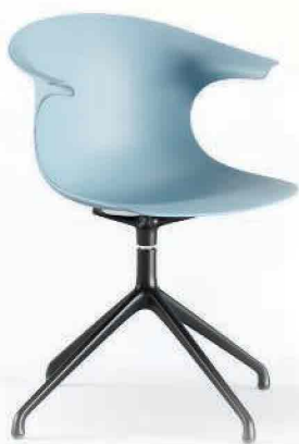
LOOP by Claus Breinholt per Infiniti Design. Scocca in polipropilene riciclato e braccioli ergonomici. infinitedesign.it